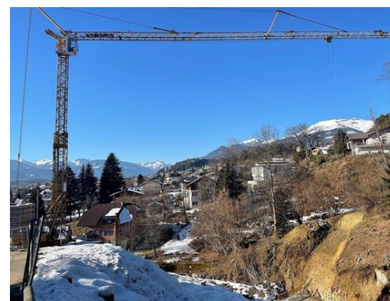
Baustelle der Wildbach- und Lawinenverbauung in Seeboden

Aufmerksamen Passanten ist die Baustelle beim Trefflinger Gießbach schon aufgefallen : Seit November 2021 wird hier im Auftrag der Wildbach- und Lawinenverbauung (WLV) fleißig gearbeitet. Der Gießbach ist bei Starkregen schon seit Jahren ein Sorgenkind: Zuletzt 2008 und 2009 gab es mehrere kleinere Hochwässer . Aufgrund der fehlenden Geschiebemanagement im Unterlauf sowie fehlender Verbauungen in Treffling, war der Sicherungsbau schon seit 2016 geplant . Geschützt werden damit die dicht besiedelten Ortskerne von Seeboden und Treffling sowie der Ortsteil Liedweg , wo sich