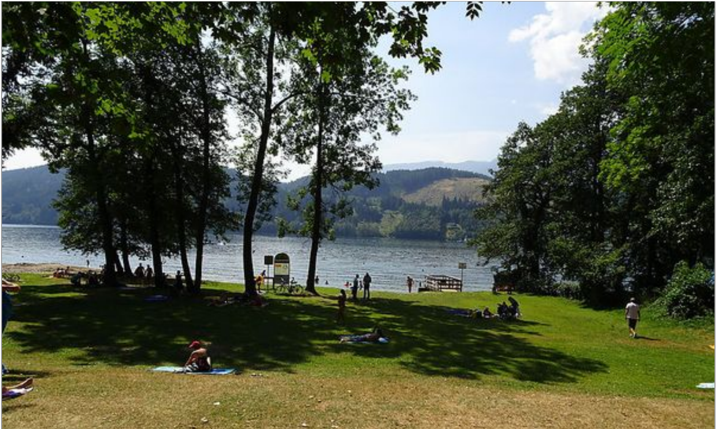
Der Gießbach mündet über den Klauerpark in den Millstätter See