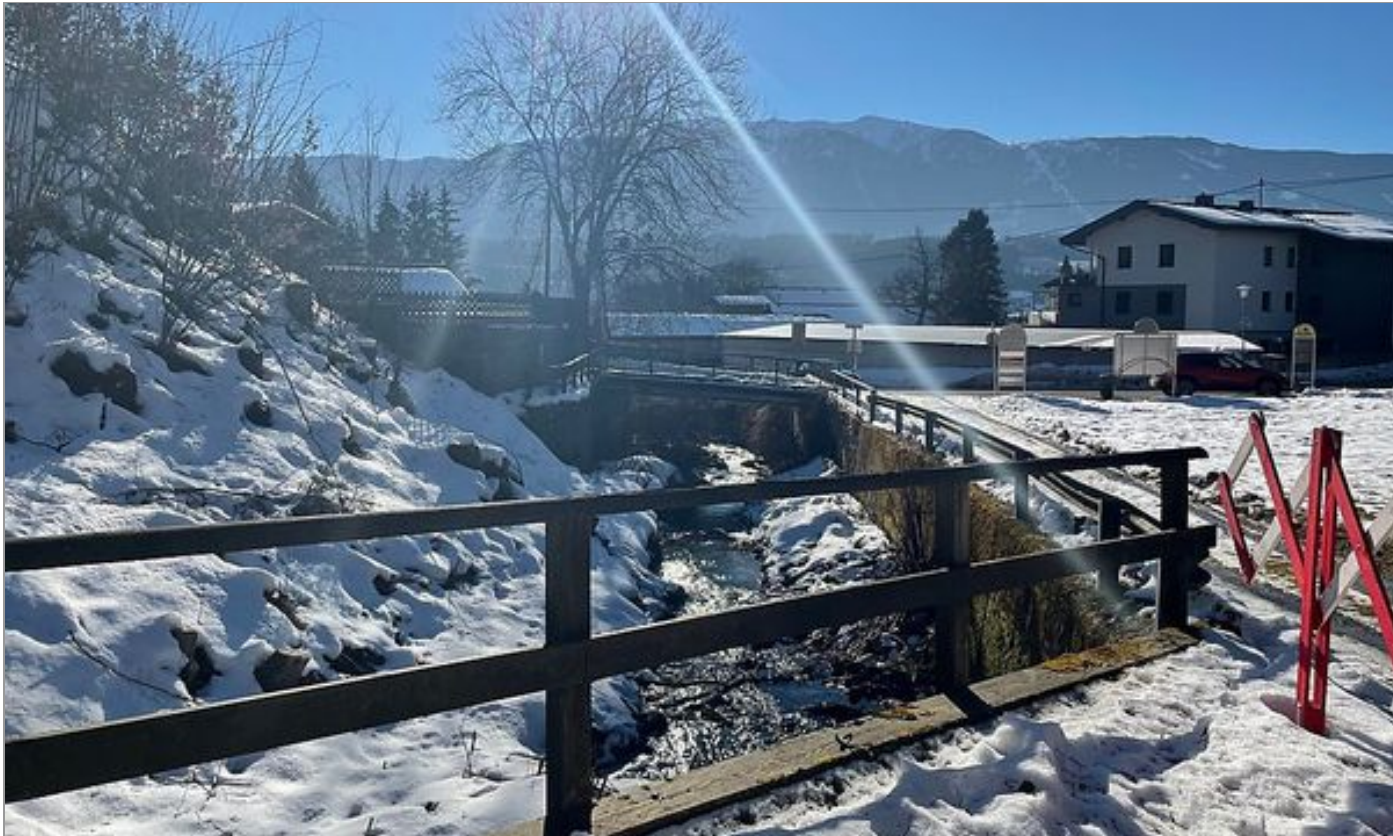
WLV-Baustelle im Bereich Tangernerstraße

insgesamt 84 private Wohn- und Nebengebäude, 13 landwirtschaftliche Objekte, elf Fremdenverkehrs- und drei öffentliche Gebäude sowie zahlreiche öffentliche Einrichtungen und vier Gewerbebetriebe, die sich in der Wildbach-Gefahrenzone befinden. Insgesamt werden 2,6 Millionen Euro investiert, rund 600.000 Euro finanziert davon die Gemeinde.